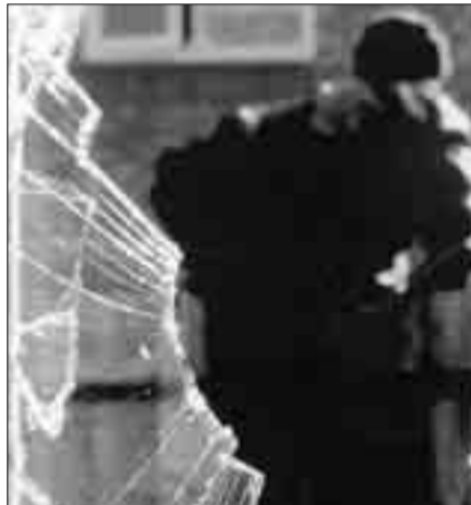
ROTTA. Una vetrata dopo un furto

I reati (per ogni età) riguardano specialmente i furti d'ogni tipo (53%), seguono i danneggiamenti (12%) e le minacce ed ingiurie. Di ben pochi reati denunciati si scopre il colpevole. Rimangono di autore ignoto nella misura dell'81,64 per cento. Quantità che fa riflettere e che corrisponde al malumore popolare in merito. Durante la sua illustrazione, Caneppele ha sottolineato come molti reati nemmeno vengano denunciati. Per sfiducia nelle capacità investigative dei soggetti preposti?