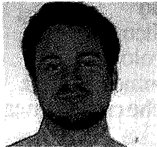
Ricerca Marco Dugato, di Trans- crime